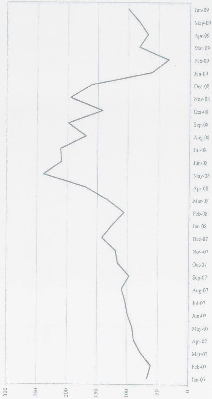
Зураг 2: Түүхий эд материал болон тоног төхөөрөмжийн импортыг хассан дүн (өөрчлөлтийн хувиар)