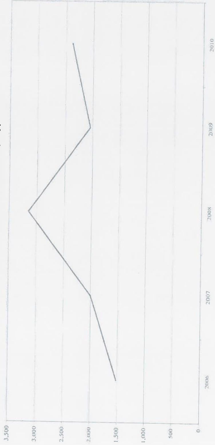
Зураг 3: Импорт (сая ам.доллараар)